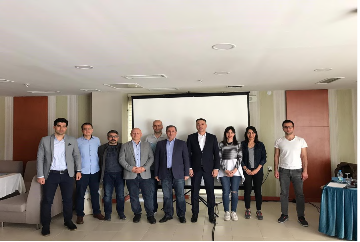
Foto: 3- 7. Olağan Genel Kurulu sonunda Yönetim Kuruluna seçilen üyelerimiz.