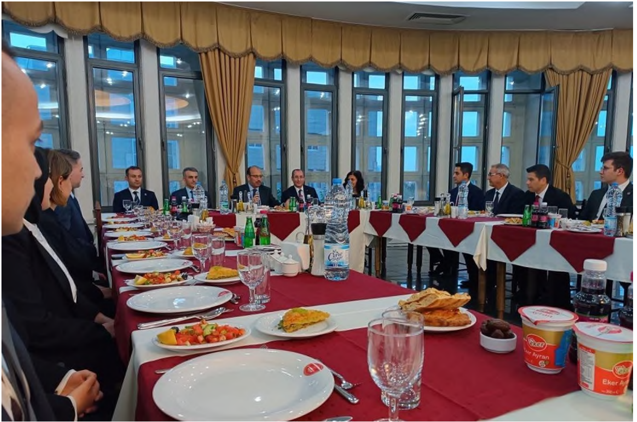
Foto: 16- 2023 Girişli Denetçi Yard. Adaylarımıza İftar ve Hoşgeldiniz yemeğimiz.