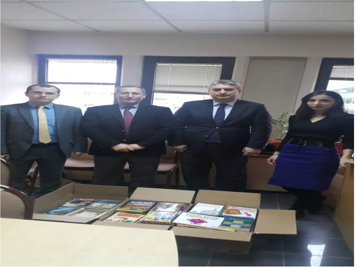
Foto: 9- Kitap baęışı kampanyamızda toplanan kitaplar ilgili yerlere gönderildi.