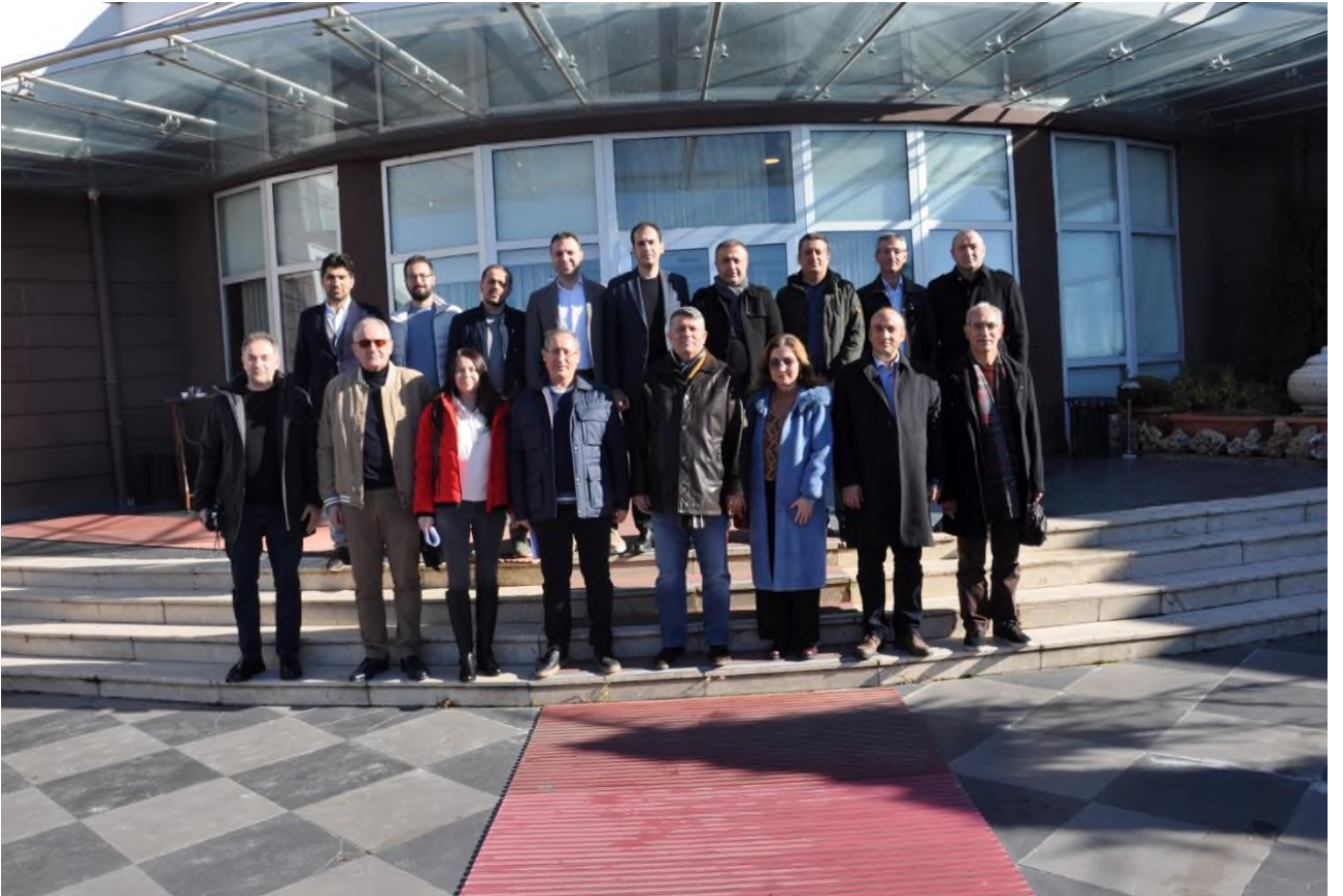
Foto: 20- DENETİM DERNEKLERİ Yöneticileri Buluşması