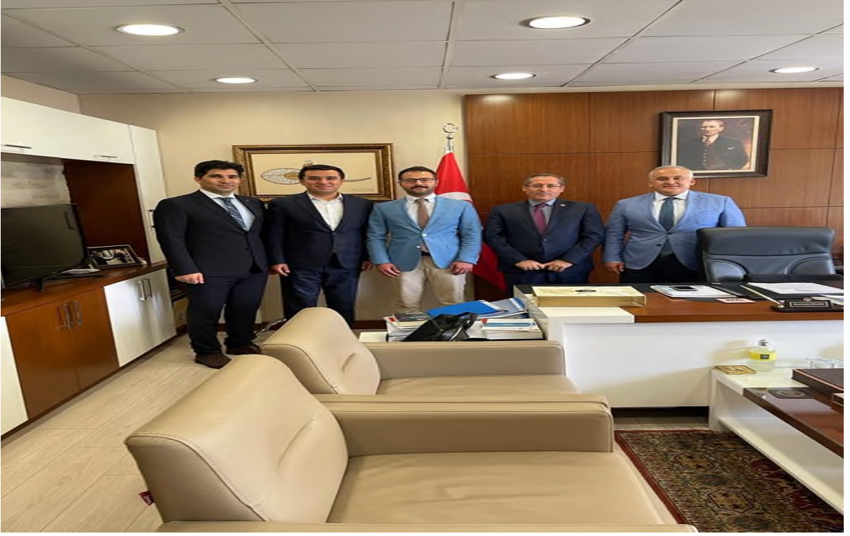
Foto: 17-Sivil Toplumla İlişkiler Genel Müdür V. Ziyareti