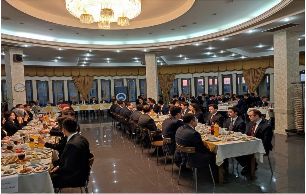
Foto: 15- 2022 Girişli Denetçi Yard. Adaylarımıza İftar ve Hoşgeldiniz yemeğimiz.