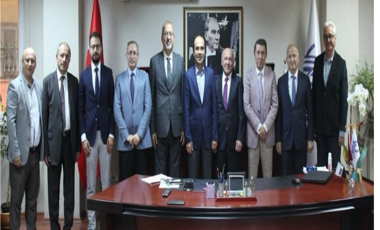
Foto:18- Ankara YMM Odası Yönetim Kurulu Başkan ve Üyeleri Ziyareti