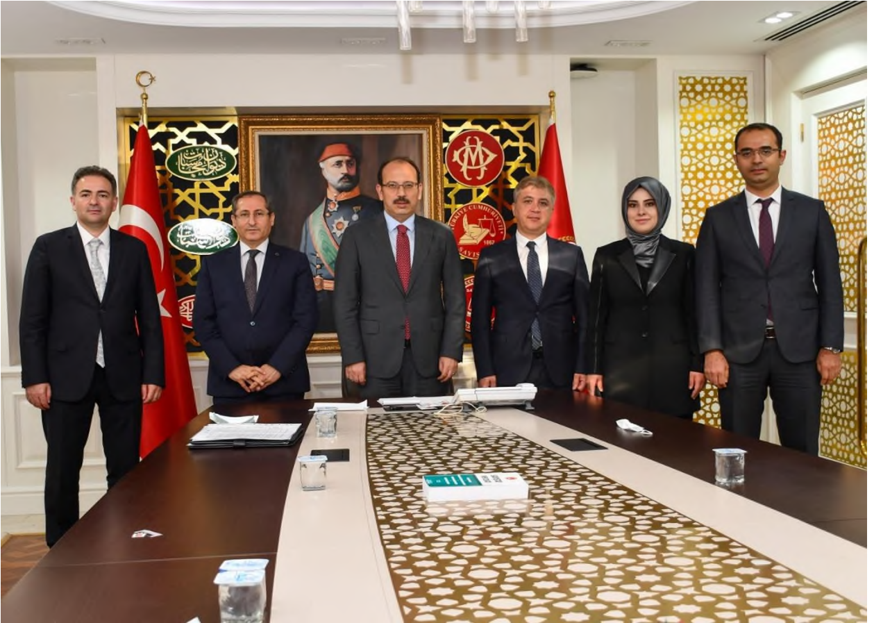
Foto: 5,6- 7. ve 8. Olağan Genel Kurulu sonrası Sayıştay Başkanlarımızı ziyaretimiz.