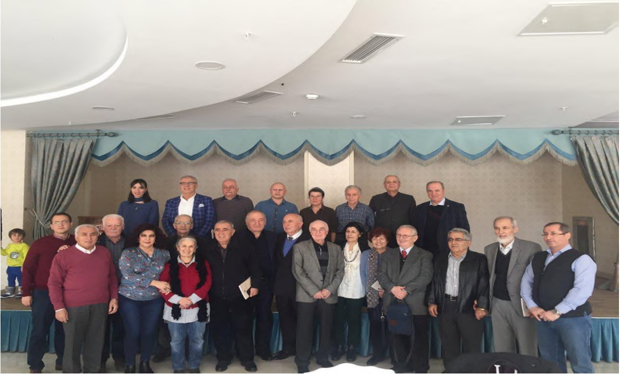
Foto: 7- Emekli meslektaşlarımızla kahvaltıda buluştuk.