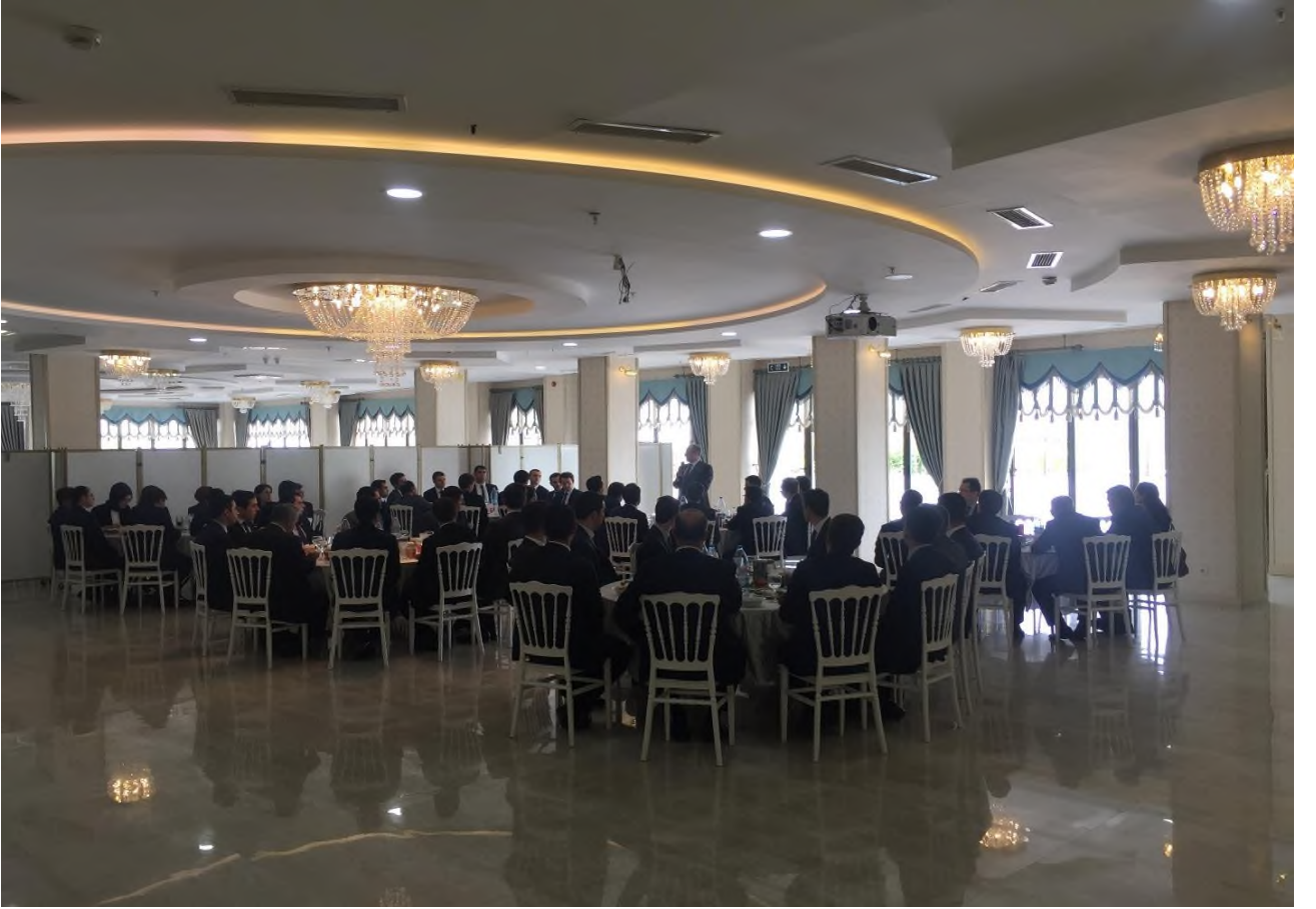
Foto: 8- Genç meslektaşlarımızla hoş geldiniz yemeđi.