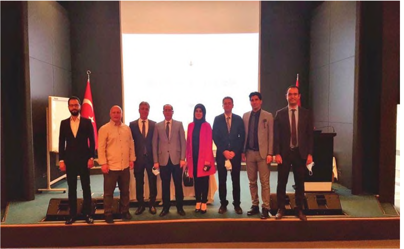
Foto: 4- 8. Olağan Genel Kurulu sonunda Yönetim Kuruluna seçilen üyelerimiz.