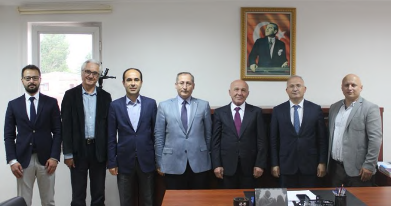
Foto: 19- Ankara YMM Oda seçimleri sonrası yönetim Kuruluna seçilen meslektaşlarımıza ziyaret.